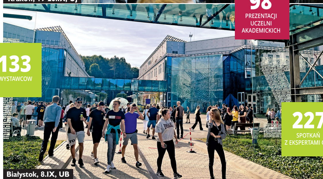
Białystok, 8.IX, UB