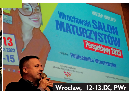
Wrocław, 12-13.IX, PWr