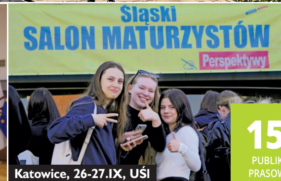
Katowice, 26-27.IX, UŚI