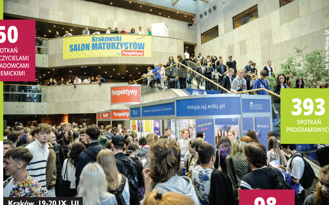
Kraków, 19-20.IX, UJ

50 SPOTKAŃ Z NAUCZYCIELAMI I WYKŁADOWCAMI AKADEMICKIMI