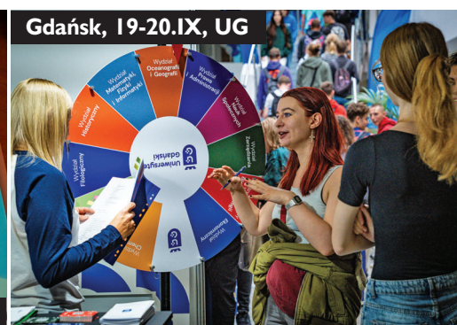
Gdańsk, 19-20.IX, UG