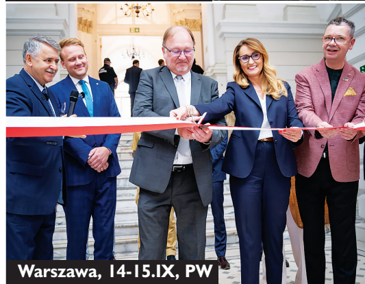
Warszawa, 14-15.IX, PW