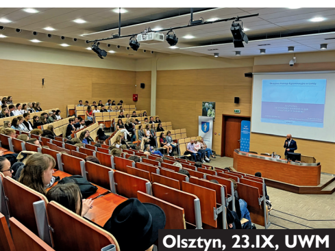
Olsztyn, 23.IX, UWM