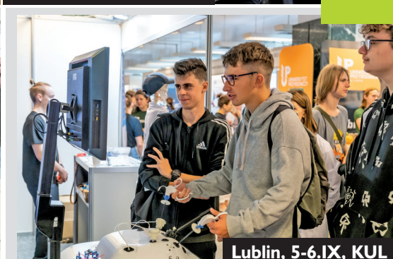
Lublin, 5-6.IX, KUL