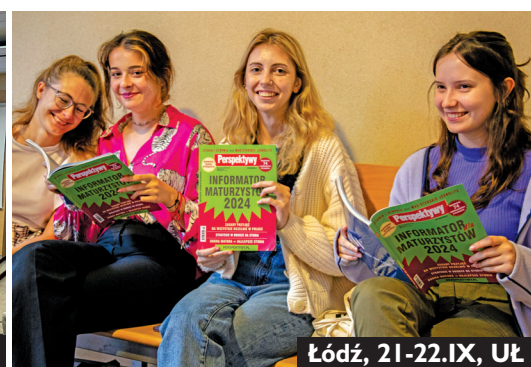
Łódź, 21-22.IX, UŁ