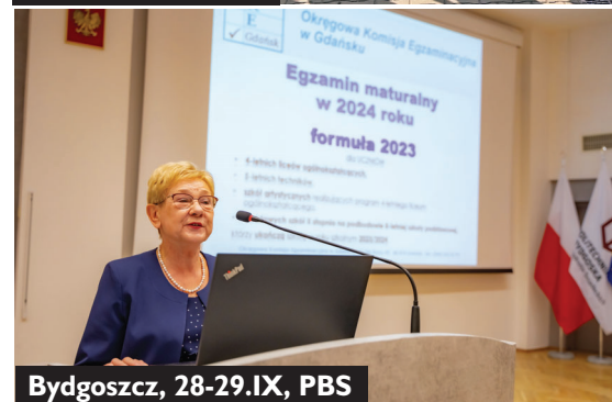
Bydgoszcz, 28-29.IX, PBS