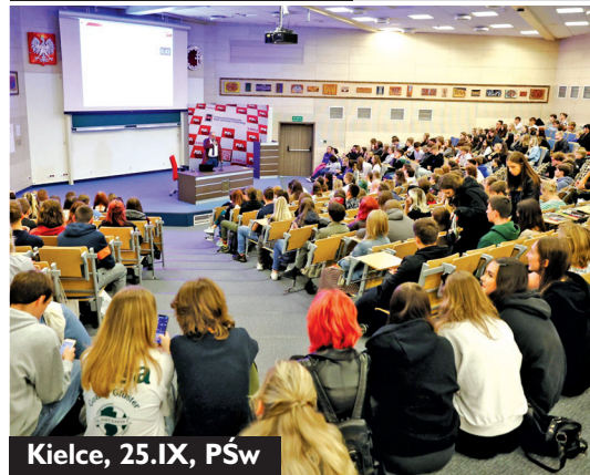
Kielce, 25.IX, PŚw