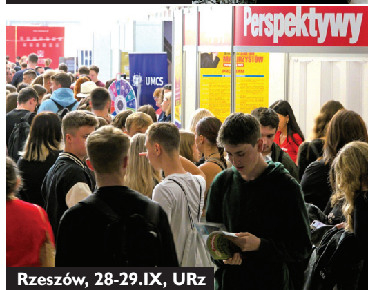
Rzeszów, 28-29.IX, URz