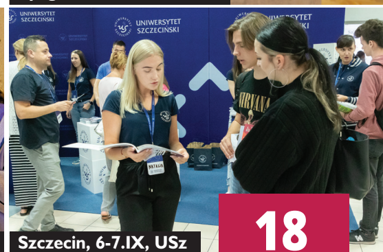
Szczecin, 6-7.IX, USz